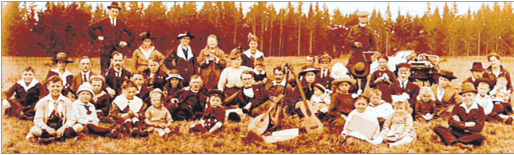
Auf der Hohen Maas entflohen die Arbeiterfamilien Anfang der 20er Jahre ihrem schweren Alltag. An der Bakuninhütte konnten sie ihre Freiheit genießen, aber sich auch Gedanken über ein besseres Leben in einer freiheitlich-sozialistischen Gesellschaft machen. REPOS (2): WANDERVEREIN BAKUNINHÜTTE E.V.