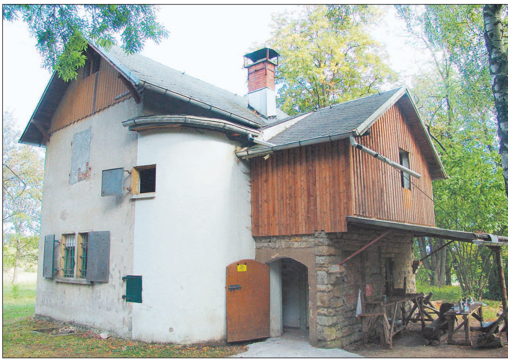
Die Bakuninhütte heute. Der drohende Verfall wurde durch den Verein bereits gestoppt, doch bleibt noch viel zu tun in der Zukunft. Jede Hilfe ist willkommen.

Es entstand ein „Siedlungsverein für gegenseitige Hilfe“, dessen Mitglieder zum Teil der FAUD (Freie Arbeiter Union Deutschlands), der wichtigsten Massenorganisation des deut-