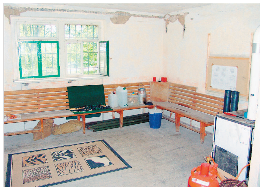
Im Innern der Bakuninhütte hat sich schon eine Menge getan. Das linke Bild zeigt den unteren Raum, der Wanderern auch in Zukunft Schutz bieten soll. Rechts ein Blick ins Obergeschoss. Dort wurden bereits viele verfaulte Balken ausgetauscht.